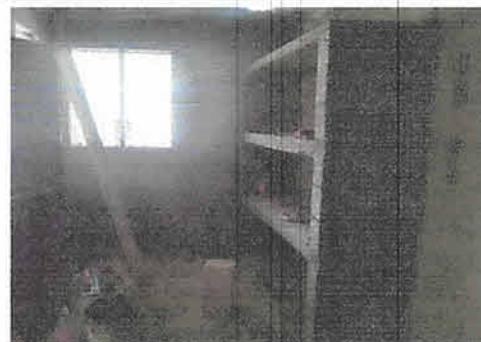
Foto 2: Elaboración de repisa de cemento para área de cocina 3 entrepaños de 2 metros de largo por 0.50 metros de ancho.