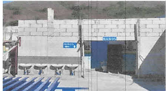
Foto 8: Sustitución de estructura de soporte de madera y lámina, por estructura metálica y lámina troquelada aluzinc calibre 26 en área de baños.