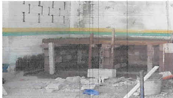
Foto 10: Elaboración y fundición de gabinete para bodega de 2 metros de largo por 1 metro de ancho.