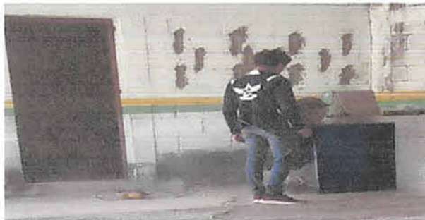
Foto 11: Elaboración de dos puertas de metal para gabinete de bodega, medida 80 por 80 centímetros cada una.