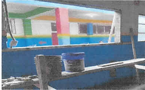
Foto 7: Aula 2, Elaboración de ventana de 2.05 de largo por 1 metro de alto, con paletas de vidrio y estructura de aluminio