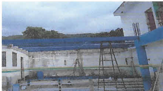
Foto 9: Instalación de galera estructura metálica y lámina troquelada aluzinc calibre 26 área de patio.