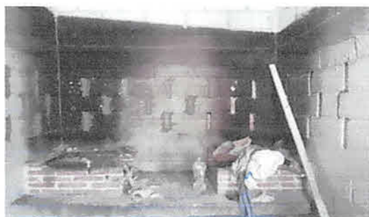
Foto 3: Reparación de dos estufas rurales, con plancha de metal cada una y su respectiva chimenea para extracción de humo.