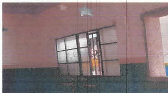
Foto 4: Aula 1, Sustitución de ventana de metal y vidrio por ventanas de paletas de vidrio y estructura de aluminio medida 2.25 de largo por 1 metro de alto.