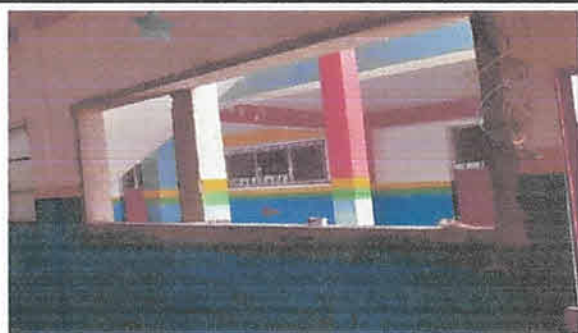
Foto 5: Aula 1, Elaboración de ventana de 2.10 de largo por 1 metro de alto, con paletas de vidrio y estructura de aluminio.