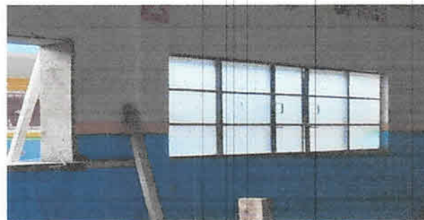
Foto 6: Aula 2, Sustitución de ventana de metal y vidrio por ventana de paletas de vidrio y estructura de aluminio medida 2.10 de largo por 1 metro de alto

Observación: Si es necesario se pueden agregar hojas adicionales y actualizar el número de hojas.