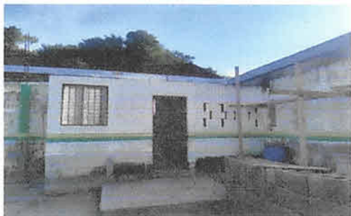
Foto 1: Sustitución de estructura de soporte de metal y lámina, por estructura metálica y lámina troquelada aluzinc calibre 26 en área de cocina.